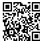
【入力フォームのQRコード】